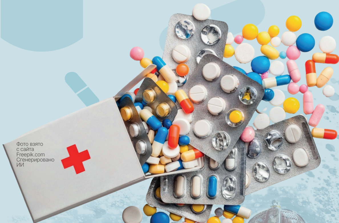
Сгенерировано ИИ

Фармаколог и фармацевт: братья по разуму или заклятые друзья? На первый взгляд, эти названия звучат почти одинаково, но поверьте, между ними целая пропасть знаний и ответственности.